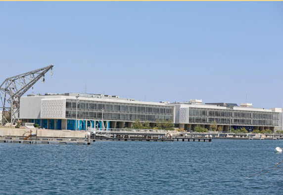
Instalaciones de EDEM en Marina de Empresas.